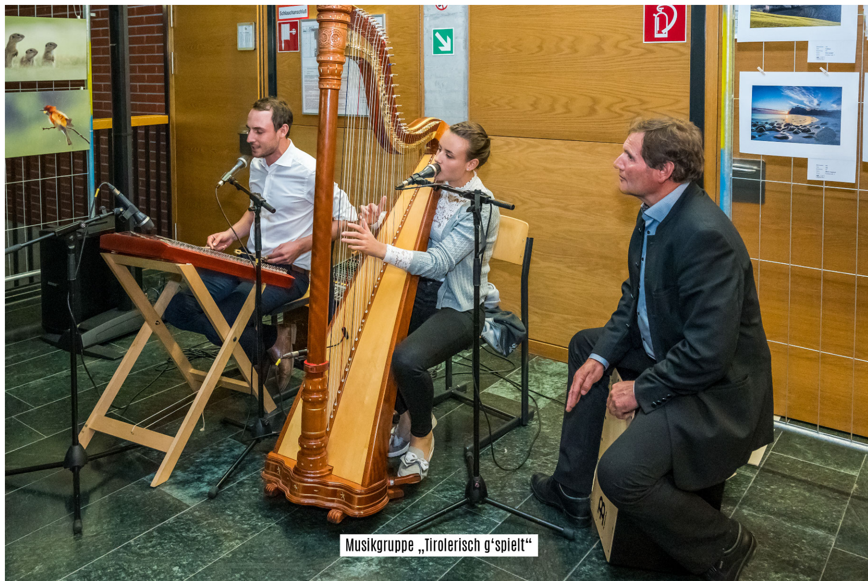
Musikgruppe „Tirolerisch g’spielt“