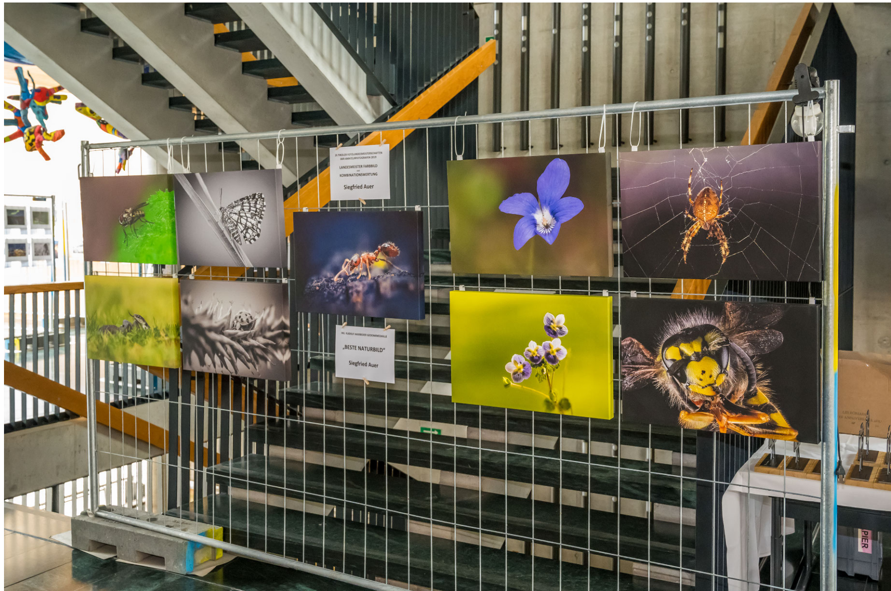
ULTRAKURZE FOTOLANDSCHAFTEN DER ANATOLISCHEN GEBIRGE 2019 LANDESMESTER FARBBLD KOMBINATIONSWERTUNG Siegfried Auer