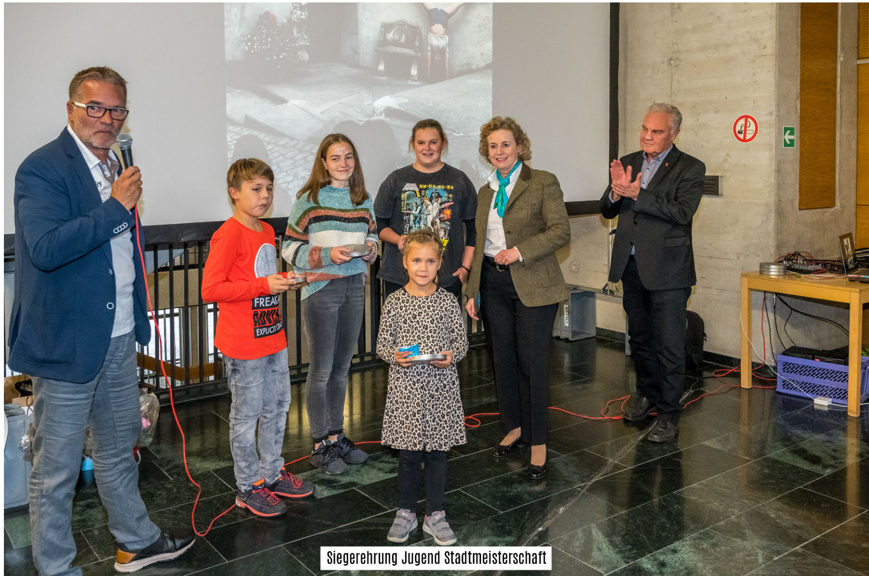
Siegerehrung Jugend Stadtmeisterschaft