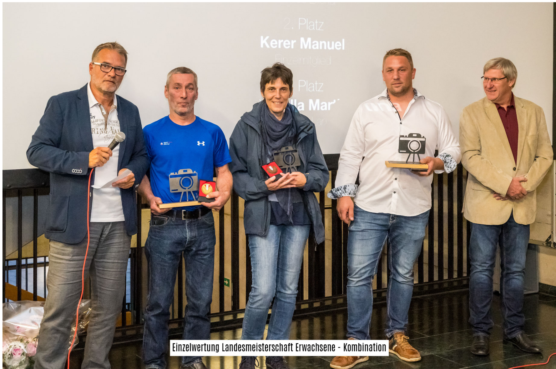
Einzelwertung Landesmeisterschaft Erwachsene - Kombination