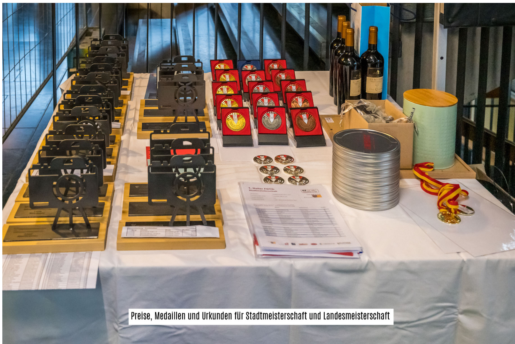
Preise, Medaillen und Urkunden für Stadtmeisterschaft und Landesmeisterschaft