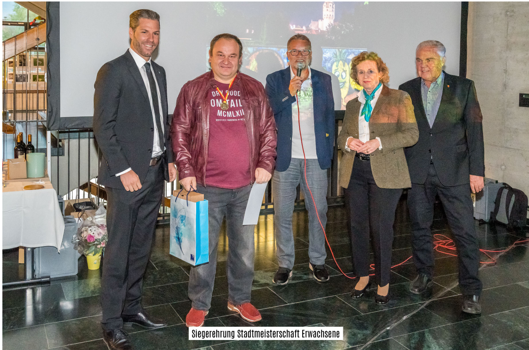
Siegerehrung Stadtmeisterschaft Erwachsene